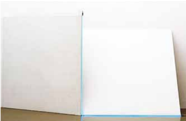
2 CARRES FORMANT UN ANGLE DE 30° Installation avec neon, (160 x 160 cm) x 2 - 1980 François Morellet