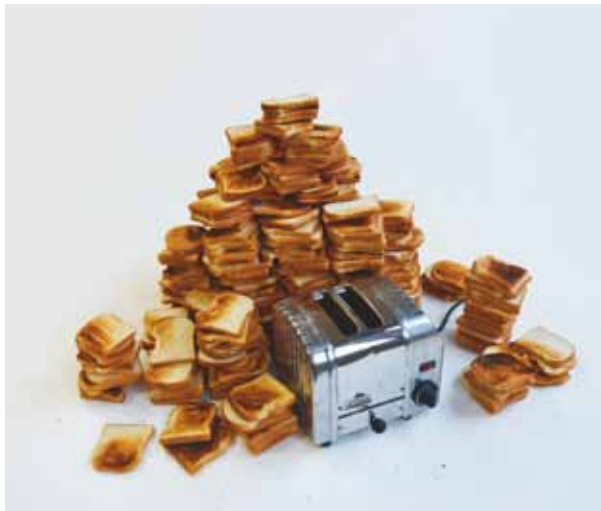
NO MORE REALITY:ALF Installation, variable - 1991 Philippe Parreno

ment de travail que j'ai sous les yeux, je regarde les dates des uvres et celles de leur acquisition. Chacune marque une étape régulière d'un processus continu, exigeant. Chacune montre la régularité d'un cheminement commencé il y a trente ans et ne saurait s'interrompre. Le superbe Erró de 1977, acquis en 1983 marque le commencement. La photographie d'Isabelle Le Minh de 2012, acquise en 2014, marque la dernière étape. Au total quelque vingt-cinq pièces de grande qualité, marquant chacune à leur façon la singularité d'un propos, la dimension absolument libre des choix de notre ami.